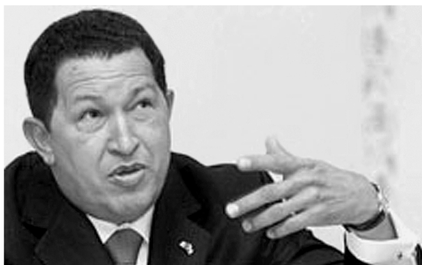
Президент Венесуэлы Уго Чавес

зация является исключительно частной инициативой 13 . Кроме того, Венесуэла боялась того, что Гайана может попасть под американское влияние.