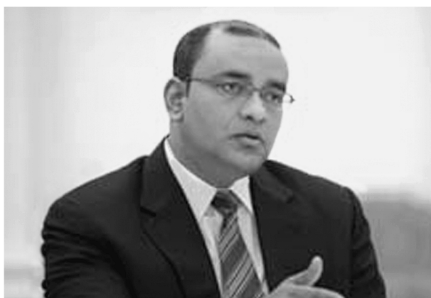
Президент Гайаны Бхаррат Джагдео

жорной ноте. Назвав отношения с Гайаной начавшимся «процессом любви», президент Венесуэлы произвел хорошее впечатление на гайанцев, пригласил нескольких школьников навеситить его в Каракасе (правда, эта поездка так и не состоялась). В ходе встречи двух президентов были заключены многие основополагающие соглашения. Так, на Гайану было распро-