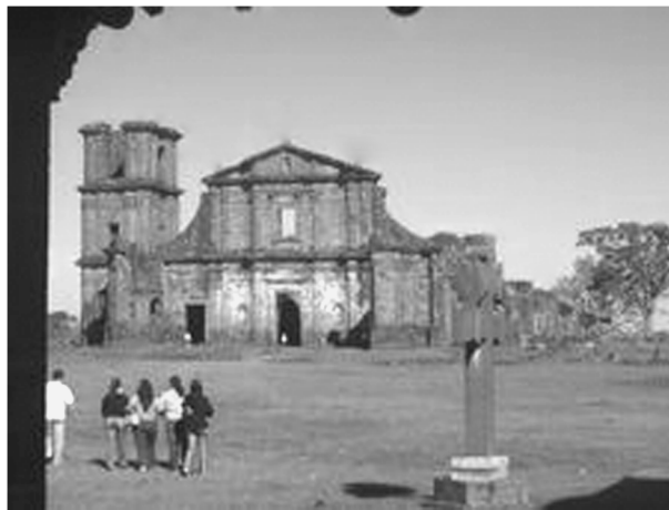
Руины одной из редуций на территории современной Аргентины

рицхоффера, писавшего о французском путешественнике Л.-А. де Бугенвиле, посетившем в ходе кругосветного путешествия Буэнос-Айрес, этих самых редуций даже издали в глаза не видели, тем более, что доступ туда испанцам и индейцам как правило был запрещен. Кроме того эти современники были в большинстве своем яркими противниками редуций или просто не знавшими ситуации иностранцами, как тот же