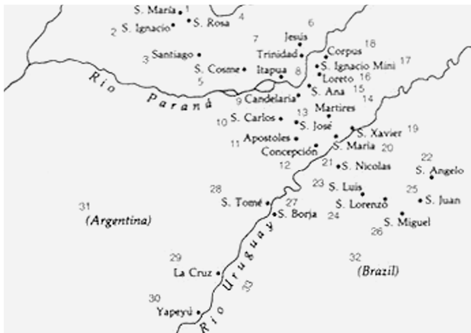
Карта главных редуций в Парагвае: 1) Санта-Мария; 2) Сан-Игнасио (св. Игнатия Лойолы); 3) Сантьяго; 4) Санта-Роса; 5) Сан-Косме; 6) редуция Иисуса; 7) Тринидад (Св. Троицы); 8) Итапуа; 9) Канделариа (Мадонны Канделарии); 10) Сан-Карлос; 11) Апостолес (св. Апостолов); 12) Консепсьон (Непорочного Зачатия); 13) Сан-Хосе; 14) Сартирес (св. мучеников); 15) Санта-Ана; 16) Лорето (Лоретской Божьей Матери); 17) Сан-Игнасио Мини (св. Игнатия Лойолы-меньшая); 18) Корпус Кристи (тела Господня); 19) Сан-Хавьер (св. Франциска Ксаверия); 20) Санта-Мария; 21) Сан-Николас; 22) Сан-Анхело (св. Ангела); 23) Сан-Луис; 24) Сан-Лоренсо; 25) Сан-Хуан; 26) Сан-Мигель (св. Михаила Архангела); 27) Сан-Борха (св. Франсиска Борджа); 28) Сан-Томе (св. Фомы); 29) Ла Крууз (Св. Креста Господня); 30) Япею; 31) Аргентина; 32) Бразилия; 33) Река Уругвай; 34) Река Парана

ритории, часто среди индейцев, розданных в энкомьенды (в «попечение», а фактически рабство) испанцам, и проблема безопасности не была острой. Но именно в результате этой работы иезуиты довольно быстро превратились в ярых противников энкомьенды и личной службы индейцев, включая миту*, полагая, что это противоречит королевским законам, что соответствовало действительности, и вредит делу евангелизации. Это ставило их в оппозицию колониальным властям, с которыми они нередко конфликтовали. Хотя фактически иезуиты лишь стремились воплотить на практике законы, утверждавшие, что индейцы — свободные вассалы короны, а не рабы. Впрочем, эти законы повсеместно нарушались в Испанской Америке еще и в XVIII в. 3