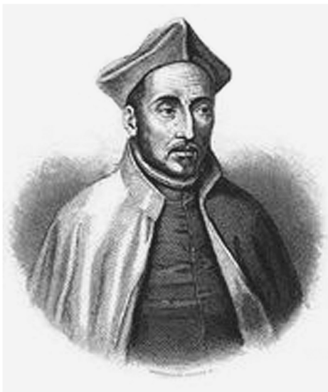
Основатель Ордена иезуитов Св. Игнатий Лойола

лась неприемлемой (они оказались именно в положении приходских священников, зависимых от местной испанской администрации). Но успех этой миссии подтолкнул вице-короля Ф. де Толедо к требованию, чтобы иезуиты взяли еще одну доктрину (приход), что шло вразрез с их уставом. Благодаря соглашательству, проявленному в данном вопросе тогдашним главой перуанских иезуитов, Хосе де Акостой*, иезуиты обосновались в Хули, крупном центре народа аймара у озера Титикака. Толедо вошел во вкус и потребовал увеличить количество доктрин, что вызвало крайне негативную реакцию Общества и способствовало постепенному перемещению деятельности миссионеров-иезуитов на окраины Перу, где их за-