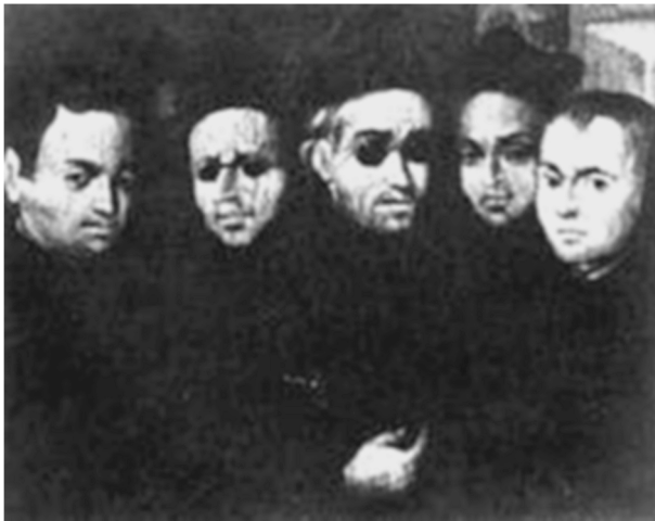
Круг Диего де Киспе Тито. Фрагмент картины из серии, посвященной процессии Corpus Christi из церкви Санта-Ана в Куско. 1660 г. Ректор коллегии иезуитов со своими сотрудниками. Куско, архиепископская коллекция

также в мастерских. Женщины были заняты прежде всего в выработке изделий из хлопка и шерсти, керамики, помогали в работе на семейных участках. Это было, кстати, одним из очень серьезных для гуарани новшеств, введенных миссионерами: прежде мужчины только расчищали поле и готовили его для посева, все остальное было делом женщин.