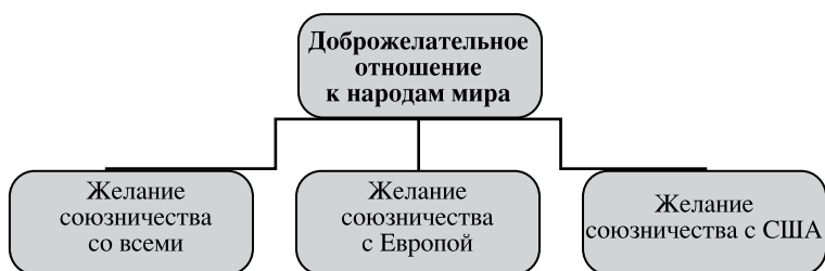
Рис. 6. Доброжелательность по отношению к народам мира.

77 человек, за насильственное – только 2: “Просто они должны побыть на чужбине и вспомнить, что у отца их даже рабы не голодают, а они делят пищу со свиньями. Что тут могут сделать русские? Работать над улучшением ситуации в своей стране и ждать”. “Для этого должно в первую очередь что-то измениться в нас”. “Оптимально – найти новую миссию для страны, с которой была бы согласна большая часть тех, кто в ней живет”. “На 90% это зависит от русских. Они должны найти себя”. “Скорее всего, так и произойдет – энергию любят все. Дело за малым – за реальной (не лживо провозглашенной) империей. Что для этого должно в них измениться? Настроение. Оно само изменится. Нахлебаются нищеты. Увидят прежних русских. И потянутся. Что тут могут сделать русские? Стать русскими не по названию, а по внутреннему содержанию”. «Нужно прекратить разрушать себя и начать строить. Вернуть осмеянные и затоптанные “столпы” нашего общества – Совесть, Честь, Самопожертвование, Отвагу. И все вокруг потянутся назад».