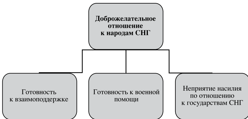
Рис. 5. Доброжелательность по отношению к народам СНГ.