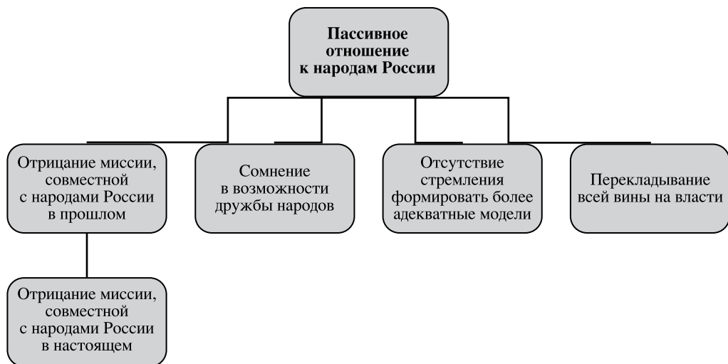
Рис. 4. Пассивность по отношению к народам России.

Об отсутствии стремления к формированию более адекватных моделей межнациональных отношений уже говорилось. Подкатегория “отсутствие стремления формировать более адекватные модели” сама отражает настроение пассивности и не способствует процессу возвращения к категории “дружба народов” .