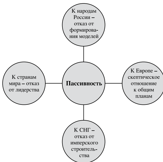
Рис. 2. Пассивность России в формировании внешних и внутренних отношений.

Таким образом, в подкатегории “дружелюбие по отношению к народам России” намечается процесс развития категории “дружба народов” . Однако он движется медленно (или стоит на месте, оставаясь благим пожеланием) в результате пассивности русских (см. рис. 2).