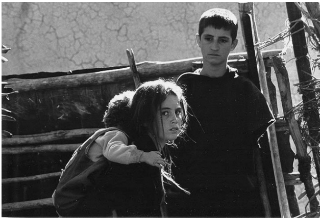
«Черепашки могут летать» (2004): Агрин со своим братом-инвалидом и сыном (слева), ребенок в окружении мин.