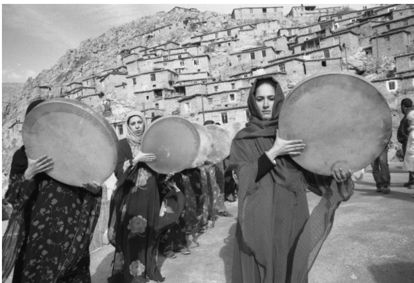
«Полумесяц» (2006). Иранские певицы в заключении.

мо, который дождался визы семь месяцев, зловещее предупреждение не останавливает еще и потому, что для него концерт - это гимн свободе Курдистана. К музыкантам присоединяется певица Хешо, находившаяся в заключении в специально отведенной деревне, куда согнали еще 1334 певицы со всего Ирана. Во время тяжелого и опасного путешествия больной, преследуемый галлюцинациями, без музыкальных инструментов и певицы (Хешо была вновь арестована иранскими пограничниками) Мамо готов покориться судьбе. Однако надежда приходит вместе с девушкой по имени Невеманг (курд. «полумесяц»), которая обещает музыканту провести его через границу в Ирак. На концерте он хочет присутствовать живым или мертвым.