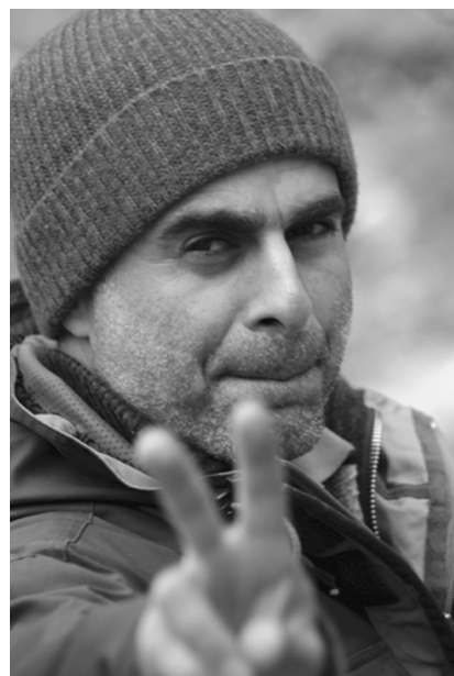
Бахман Гобад на съемочной площадке.

после переезда в Тегеран. Он получает степень бакалавра по режиссуре, закончив Иранский колледж теле- и радиовещания. Еще в студенческие годы (1990-1997) активно снимает документальные короткометражные фильмы. В первой короткометражке в качестве ассистентов и актеров из-за отсутствия средств выступили все члены его семьи. Путевкой в мир Большого кинематографа для Гобад явилась его 30-минутная «Жизнь в тумане» (1997) - работа, ставшая сенсацией на многочисленных международных кинофестивалях. Лента названа кинокритиками самым значительным событием последних лет в иранском документальном кино.